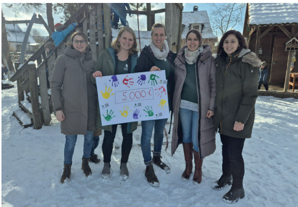
Der Vorstand des Fördervereins bei der Übergabe der Spende

Wer den Förderverein und damit auch den Waldkindergarten und die Kinder unterstützen möchte, darf gerne mit weiteren Spenden unter die Arme greifen. Für den neuen Spielturn werden zwischen 10.000 - 15.000 Euro benötigt.