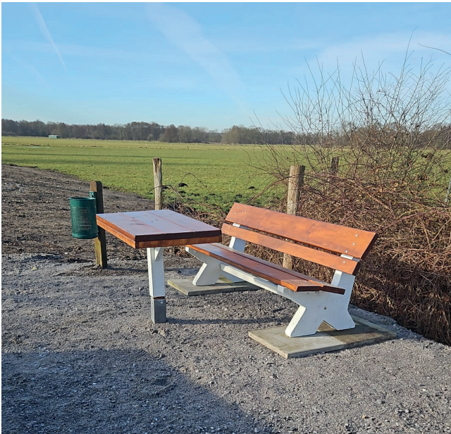
Text: Elfi Saupe Foto:

Die Arbeiten wurden Anfang März von den Bauhofmitarbeitern und Gerd Krayenborg (Mitglied des Wegeausschusses) durchgeführt.