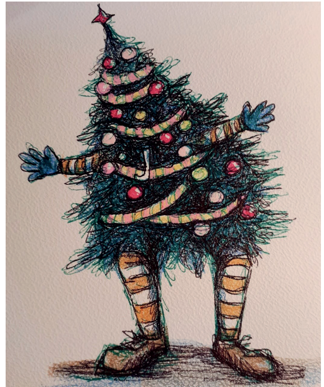
Zeichnung: Elfi Saupe, Text: Bernd Birkholz

Der Bürgerverein freut sich auf zahlreiche Besucher und einen besinnlich-fröhlichen Abend unter dem Lichterglanz des Weihnachtsbaumes.