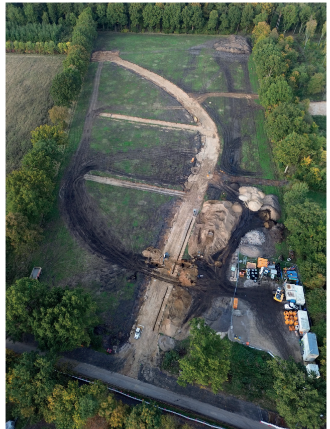
Text: Elfi Saupe

Die kompletten Planungsunterlagen zum Neubaugebiet sind über die Homepage des Amtes Auenland Südholstein einsehbar.