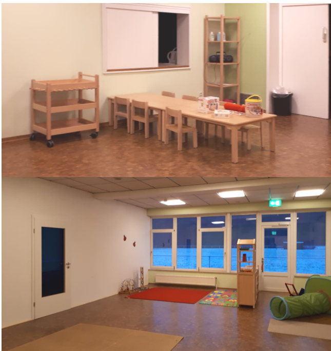
Der aktuelle Zustand des DGH

Unsere kleinsten Dorfbewohner liegen allen wirklich am Herzen.