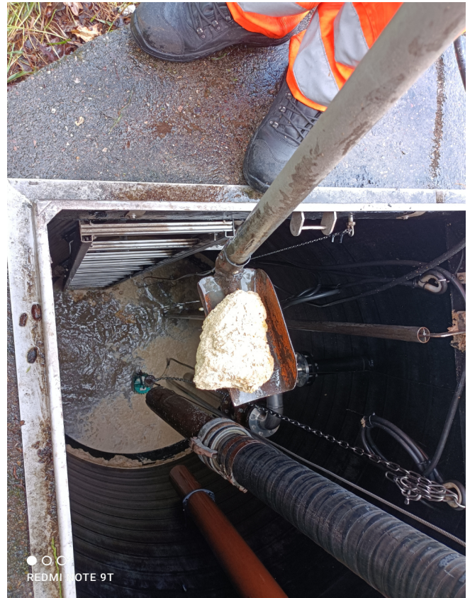
Fettbrocken in der Kanalisation

Deshalb eine dringende Bitte an alle: Größere und kleine Mengen Fett (Fritteuse) erkalten lassen und dann über den Biomüll entsorgen. Auf keinen Fall über die Kanalisation. Bratpfannen vor dem Abwasch mit einem Papiertuch auswischen. Das Fett verbindet sich sonst in der Kanalisation zu Klumpen, die ebenfalls die Pumpen