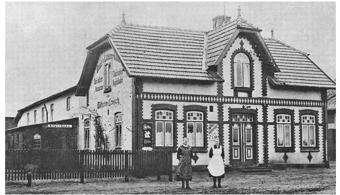
„Die Linde“ im Jahre 1921

Aus und vom Gebäude wurde mittlerweile viele Teile, die noch verwendet werden können, abmontiert und herausgenommen. Da mittlerweile Schwalben in dem