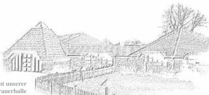
Ansicht unserer Trauerhalle

Kieler Str. 14 Kaltenkirchen Telefon 0 41 91 / 21 92 Telefax 0 41 91 / 39 90 info@augustholdorf.de www.augustholdorf.de